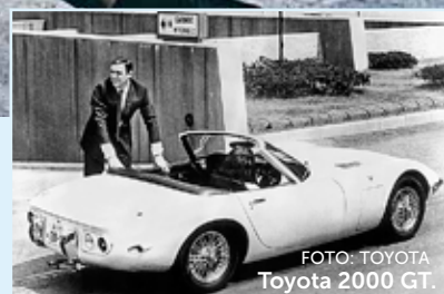
Toyota 2000 GT.